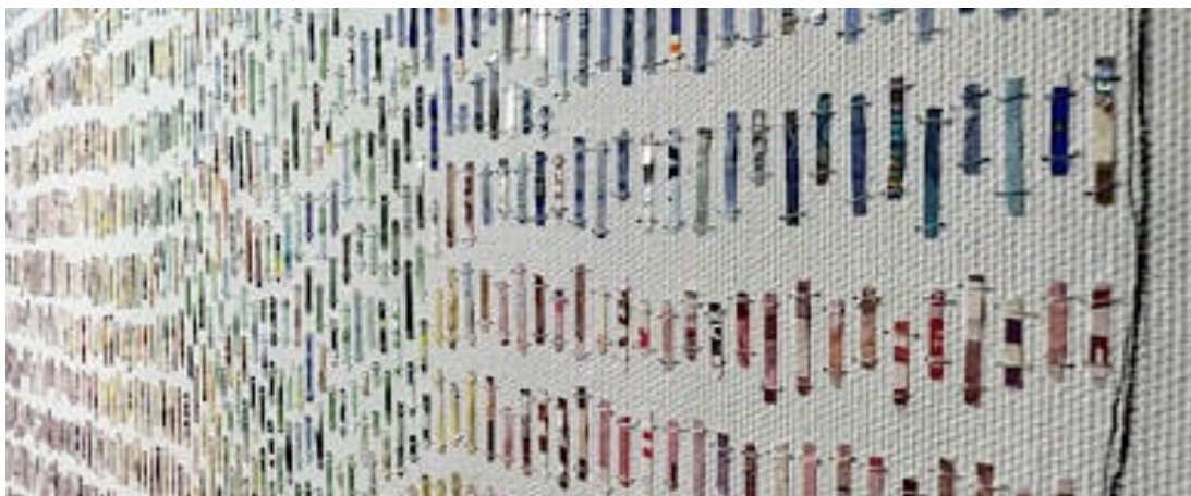
Geschredderte Banknoten, Nähgarn,, auf Leinwand 86 x 86 cm (gerahmt) 2023